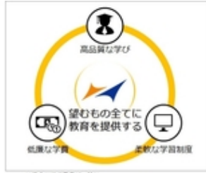
※2 私立大学通信教育課の特徴